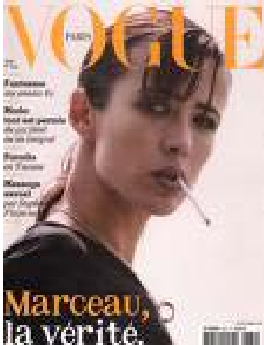
Sophie Marceau e Rita Hayworth indimenticabile Gilda