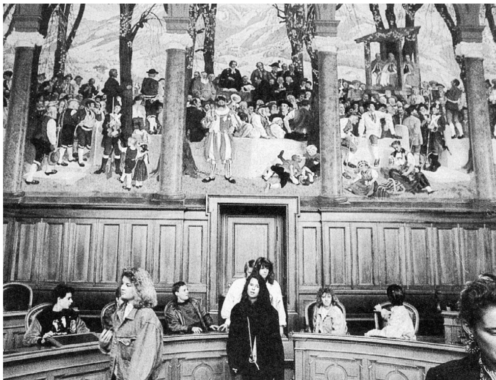
Ils juvenils èn visitaders activs dal Palaz federal e demussan uschia lur interess per noss stadi e sias instituziuns democraticas. Nossa fotografia preschenta emprendists d'administraziuns communalas en la sala dal cussegl dals chantuns avant la pictura «Die Landsgemeinde» da l'artist svizzer Albert Welti (1862-1912).